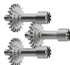
Serrure mécanique à clé MPX + 3T